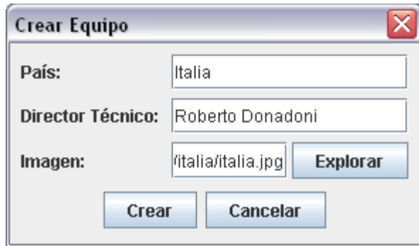
Diálogo para crear un equipo