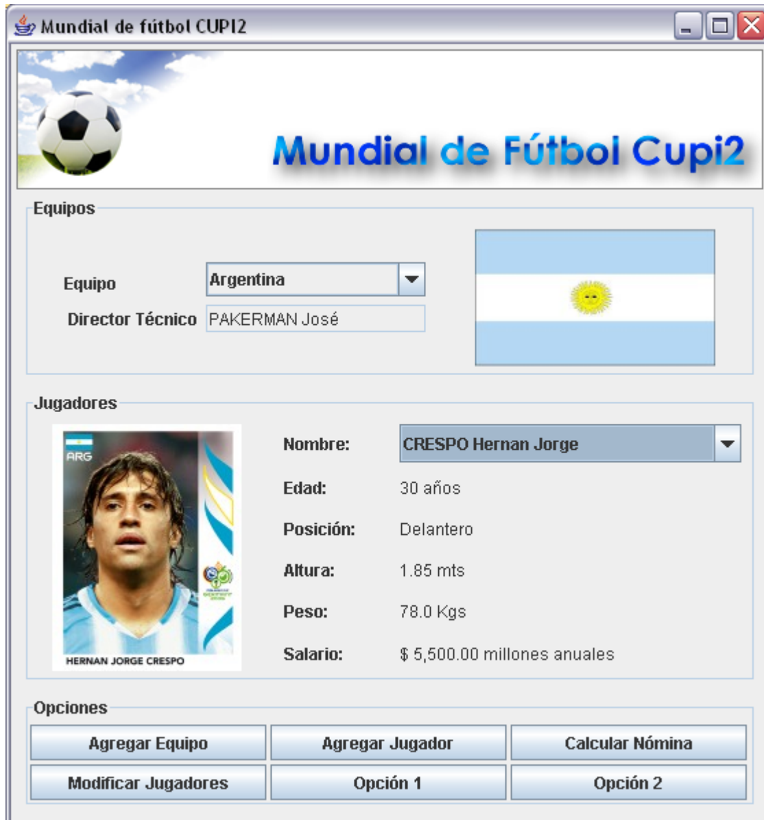
Ventana Principal de la Aplicación